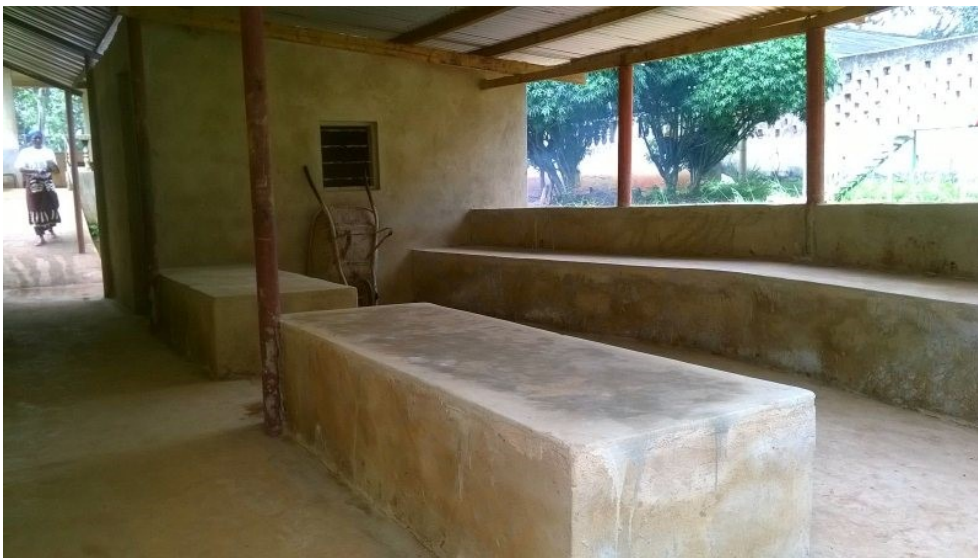
Foto2: wat meer comfort

Een overkapping gebouwd bij de doofblinde kinderen voor toilet en hygiëne, met keukenfaciliteiten en ook als relaxplek te gebruiken (foto 2 en 3).