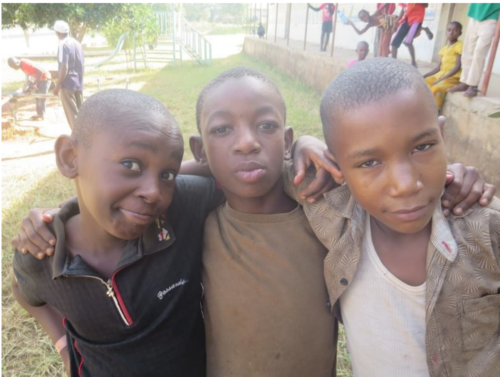
foto 3: kinderen van de Dovenschool in Kwale. Linksboven: reparatie van de draaimolen